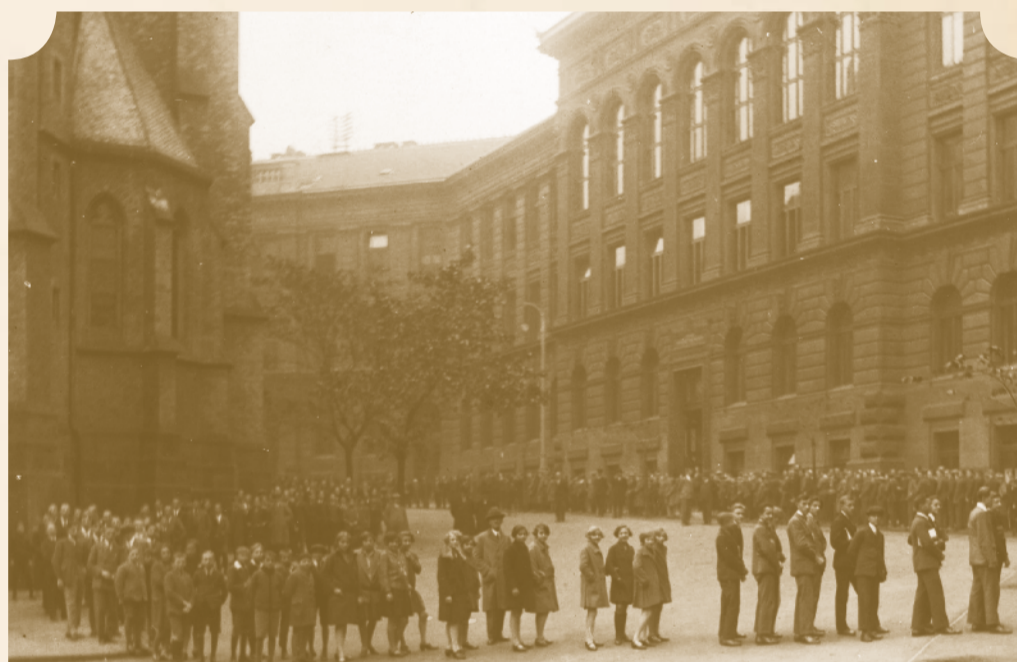
Žáci se o přestávce procházejí před budovou školy – předválečné období