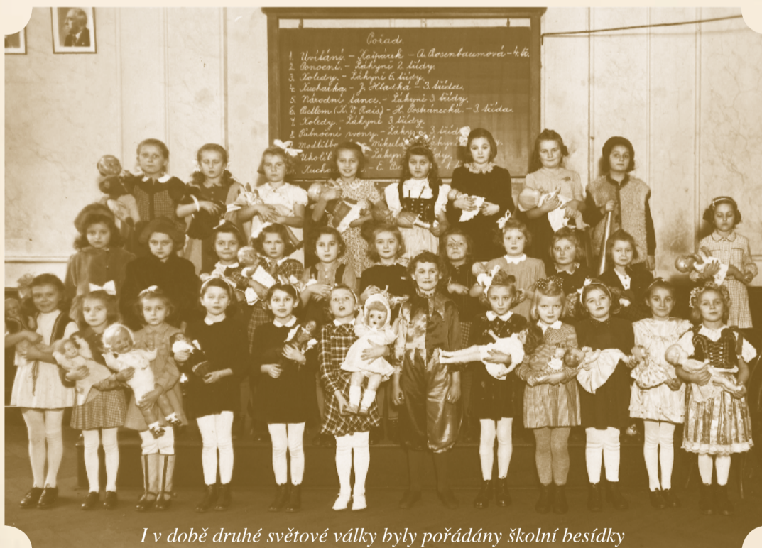
I v době druhé světové války byly pořádány školní besídky

Kapitolou v dějinách školy nejtěžší bylo období nacistické okupace. V koncentračních táborech, v partyzánských