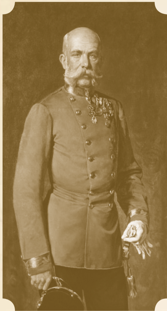
Císař František Josef I.

V e starých školních kronikách jsou kromě běžných údajů o počtu žactva, obměně profesorského sboru, nákupech učebních pomůcek atd., zachyceny i události zvláštní, významné a jedinečné. Jednou z nich je i uvítání rakouského císaře a českého krále Františka Josefa I., který dne 14. června 1901 navštívil Prahu a Žižkov a se svým doprovodem prošel i kolem budovy školy.