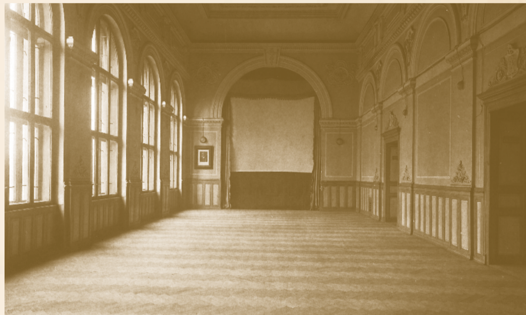
Aula školy, která původně sloužila jako kaple