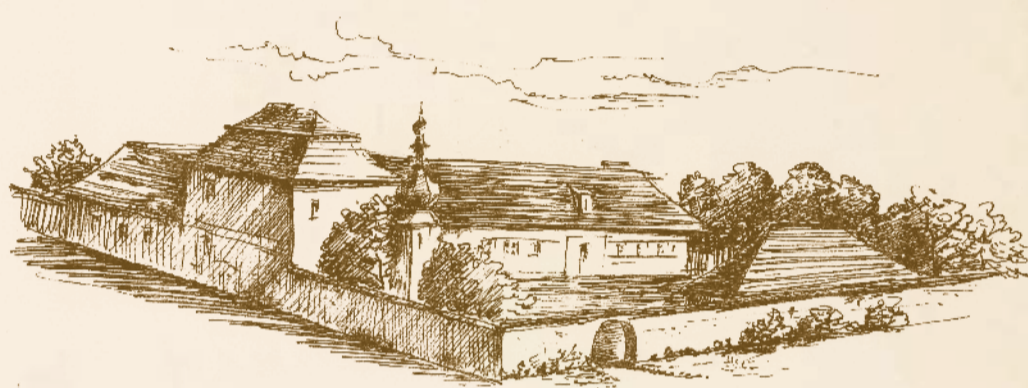
Bývalý dvorec „Reissmanka“ na pozemku dnešní školy