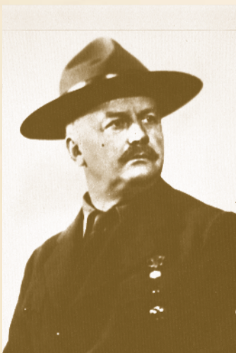
ANTONÍN BENJAMIN SVOJSÍK (1876-1938)

N a škole působil v letech 1901-1914 jako učitel tělocviku. Byl zakladatelem a propagátorem skautingu v českých zemích. Z podnětu T. G. Masaryka odjel roku 1911 do Anglie, kde se seznámil se skautským hnutím, a ještě téhož roku založil se svými žáky první skautský oddíl. Vytvořil specifickou českou formu skautingu – junáctví. Jeho představitelem byl až do své smrti r. 1938.