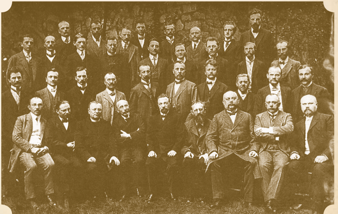
Nejstarší dochovaná fotografie učitelského sboru

Ne nadarmo během několika let své existence získala škola neoficiální přívlastek „žižkovská Sorbonna“.