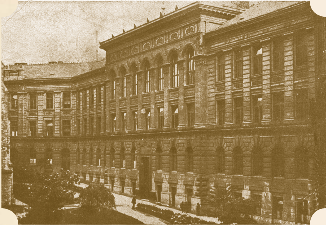
Budova školy v roce 1899